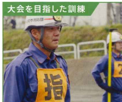
職場でも絶えない笑顔