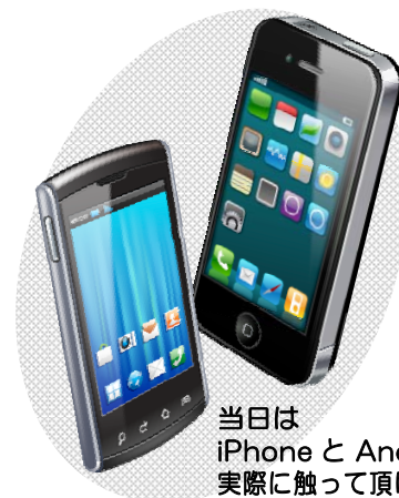
当日は iPhone と Android を 実際に触って頂けます！

そこで製造業分科会では、現在携帯市場の 50%を超えるまでに成長しているといわれるスマホと携帯電話との違いを簡単にご説明するセミナーを企画しました。この機会を活用し知識の向上を図りましょう！